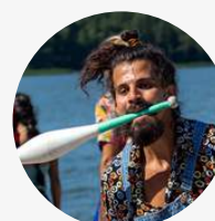
Carlos Costa Rica